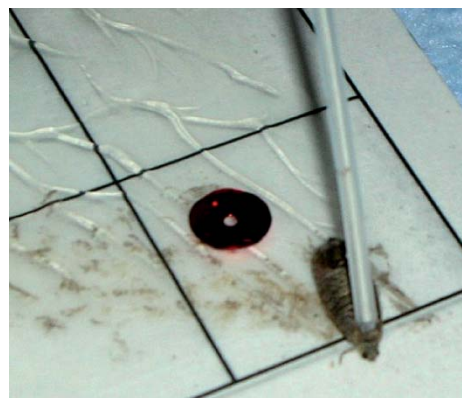
Figure 2. Traitement des papillons sur le thorax avec une micropipette

Après 48 heures, les mâles adultes de 6 des 9 vergers avaient une mortalité significativement différente de la mortalité attendue de 95 % pour une souche sensible à l'AZ, au moins à une des deux périodes d'échantillonnage.