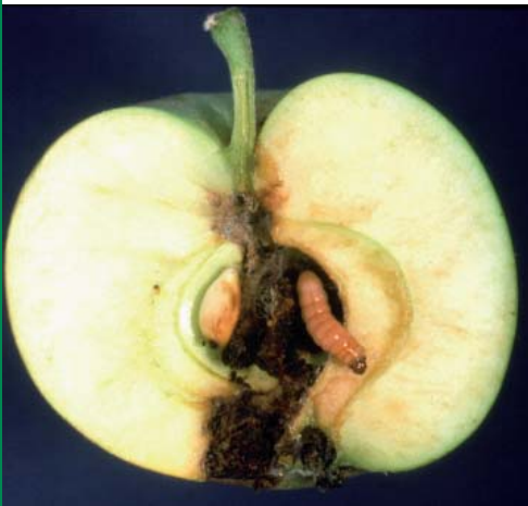
Figure 1. Dommage de carpocapse de la pomme.

Des bioessais en laboratoire ont confirmé une réduction de la sensibilité de populations du carpocapse de la pomme à deux insecticides utilisés couramment dans les vergers du Québec. Il est donc important que les producteurs adoptent ou renforcent des pratiques de réduction de la résistance afin de maintenir l'efficacité des moyens de lutte disponibles contre ce ravageur.