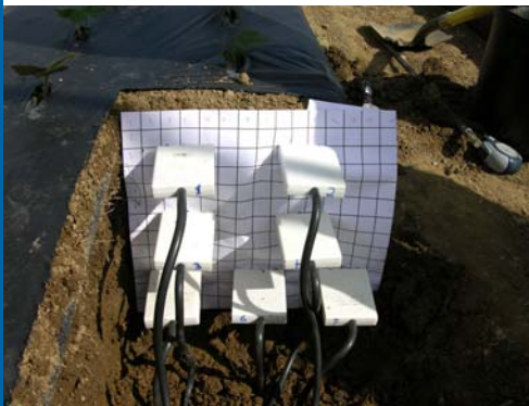
Figure 1. Sondes TDR insérées dans la demi-butte.

Des sondes à réflectométrie (TDR) ont été placées à l'intérieur des buttes de sol pour mesurer la teneur en eau volumique du sol en continu. Cette information a servi à identifier les zones de la butte qui étaient influencées par les irrigations (figure 1).