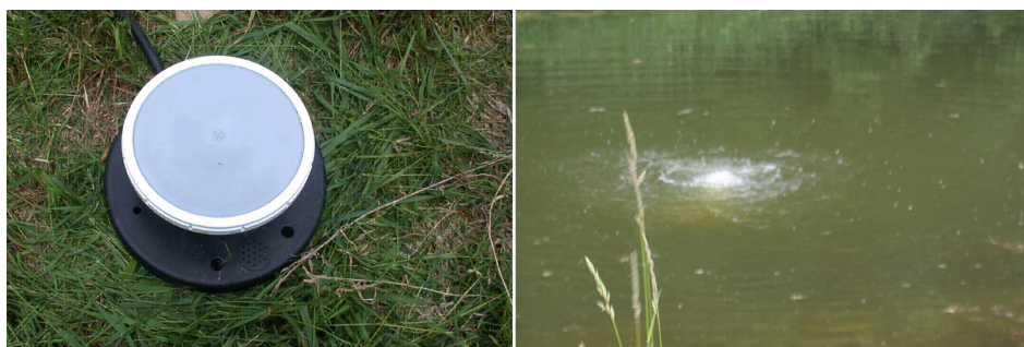
Figure 2. Diffuseur d'air à membrane et mouvement de l'eau lors de l'aération.

à 4,6 mètres (15 pieds), le coût est estimé à 4000 $ ou moins pour un système avec panneaux solaires. Les panneaux solaires représentent une partie importante de ce coût, qui chuterait à environ 900 $ avec une alimentation conventionnelle 110 volts. L'installation requiert environ trois heures de travail pour un système d'aération avec panneaux solaires, ou une heure pour un système à alimentation conventionnelle.