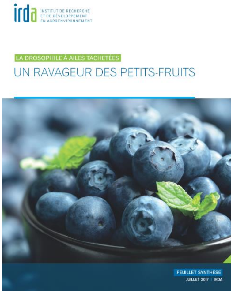
Figure 3 : Page couverture du feuillet synthèse (version juillet 2017).

Un feuillet synthèse (Fig. 3) a été produit pour les producteurs et intervenants afin de résumer l'état des connaissances actuelles sur la DA. Ce feuillet se veut un complément aux documents déjà existant du RAP et du laboratoire de diagnostic du MAPAQ. L'emphase a été mise sur les connaissances actuelles et sur les recherches en cours sans inclure de référence pour ne pas alourdir le format. Également ce feuillet comprend un arbre décisionnel provisoire pour la DAT au Québec. Ce document sera remis à jour au besoin les années futures par l'équipe de réalisation.