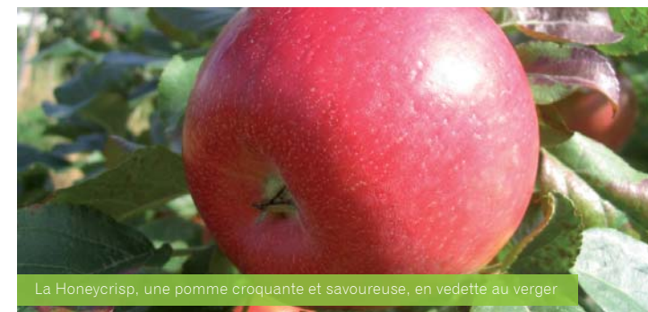
La Honeycrisp, une pomme croquante et savoureuse, en vedette au verger