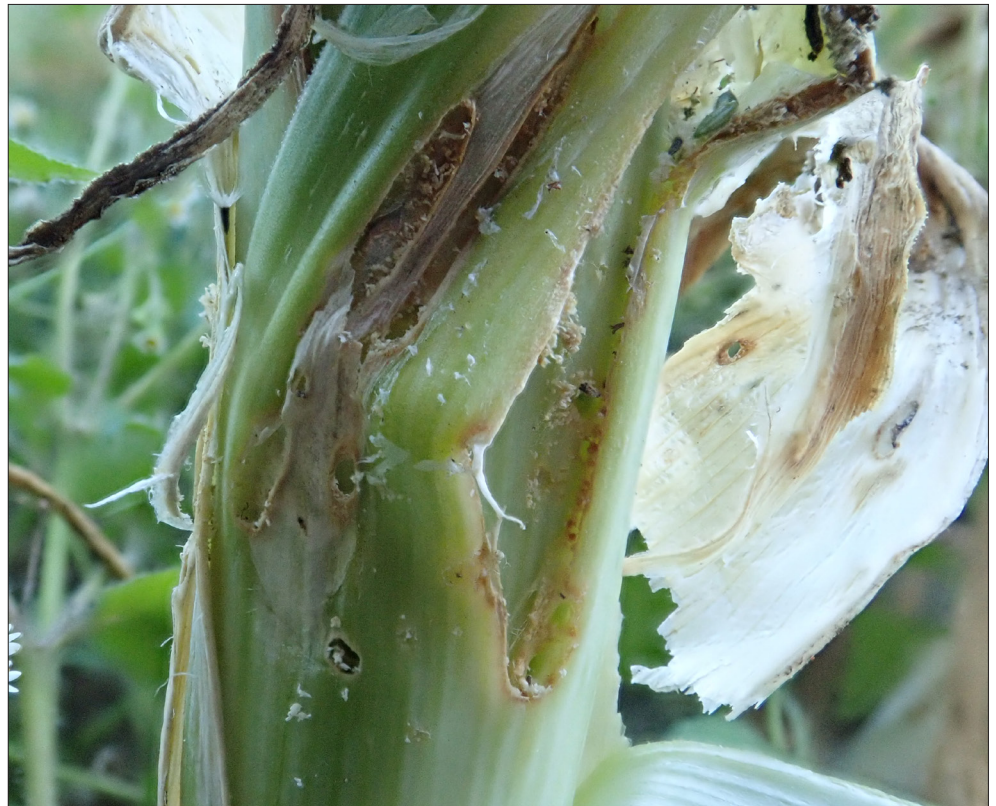
Dommages causés par des larves de teigne du poireau qui creusent des galeries et s'alimentent de tissus foliaires.