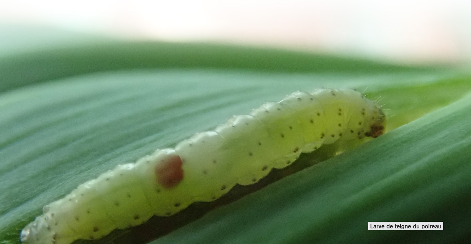
Larve de teigne du poireau