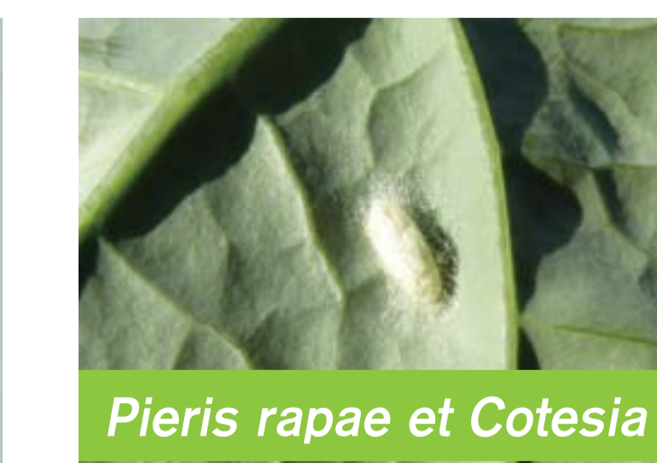
Pieris rapae et Cotesia