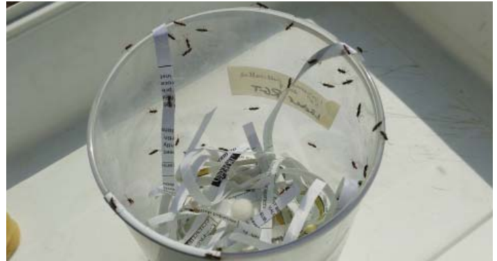
Lâcher manuel des guêpes parasitoïdes, D. pulchellus , en champ.