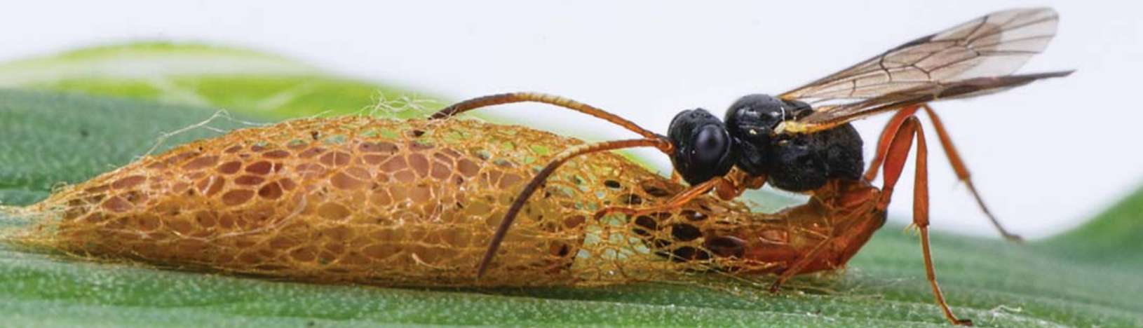
Diadromus pulchellus pond ses oeufs dans une teigne du poireau au stade de pré-chrysalide.