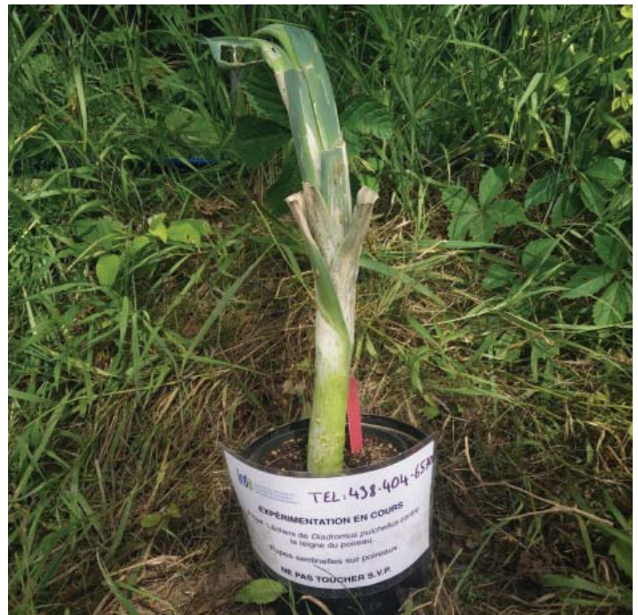
Installation d'un poireau sentinelle en bordure de champ.