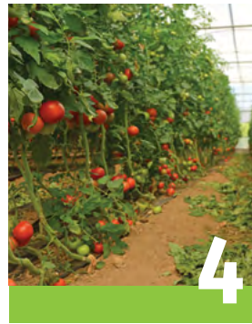
Cultures en serre et activités maraîchères hivernales