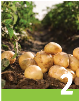
Pommes de terre