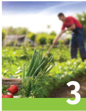
Entreprises maraîchères non mécanisées